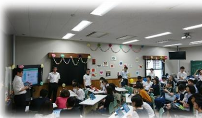
～オープンキャンパス～

高校生に向けて、ICTを活用した模擬授業を行い、ICT活用について学び深めることができました！