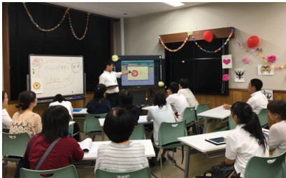
オープンキャンパス (7月)

ICT を活用した模擬授業を行いました。情報教育の重要性を実感し、ICT 活用について学びを深める機会になりました。